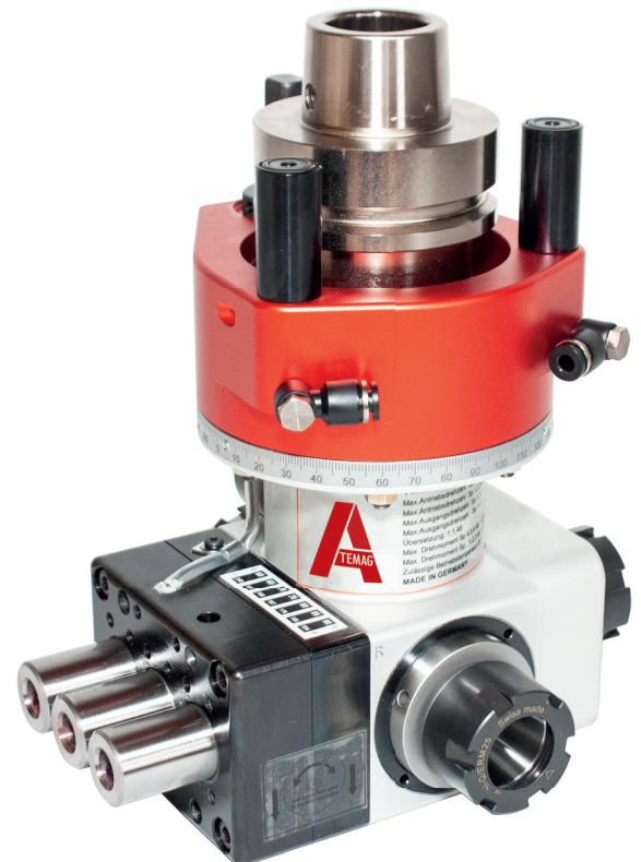
Spindelanordnung und Spindelanzahl nach Kundenvorgabe